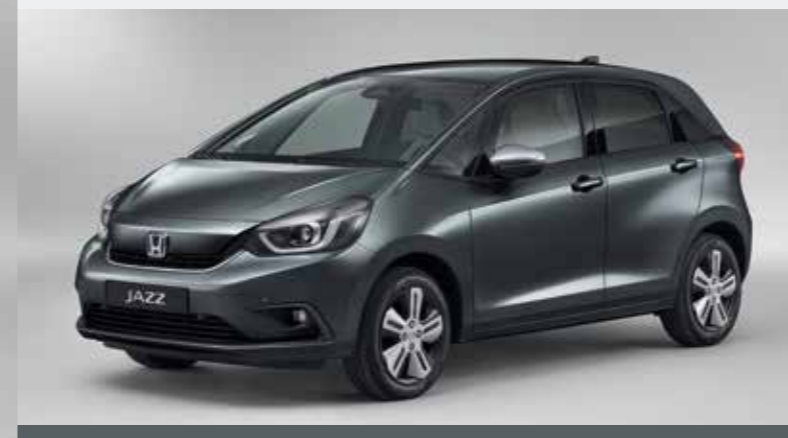
SHINING GRAY METALLIC