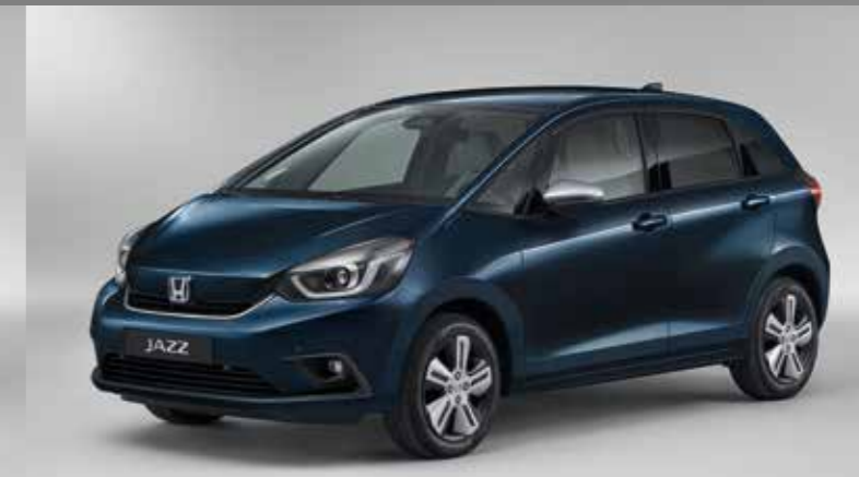
MIDNIGHT BLUE BEAM METALLIC