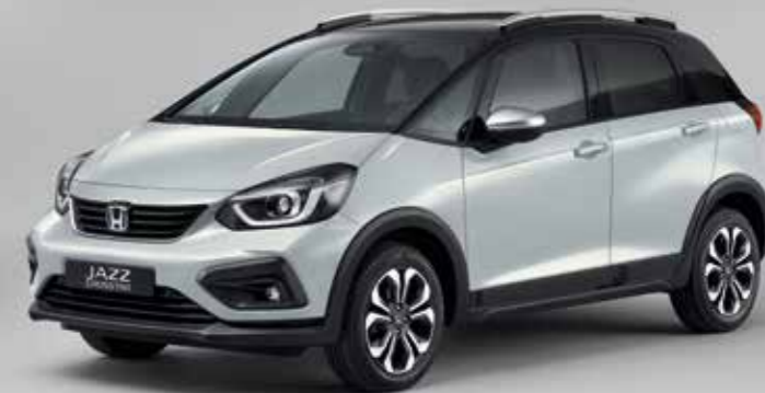
PREMIUM SUNLIGHT WHITE PEARL / KÉTTÓNUSÚ