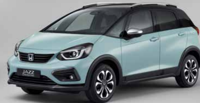
SURF BLUE / KÉTTÓNUSÚ