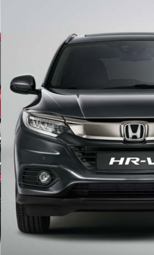
MODERN STEEL METALLIC