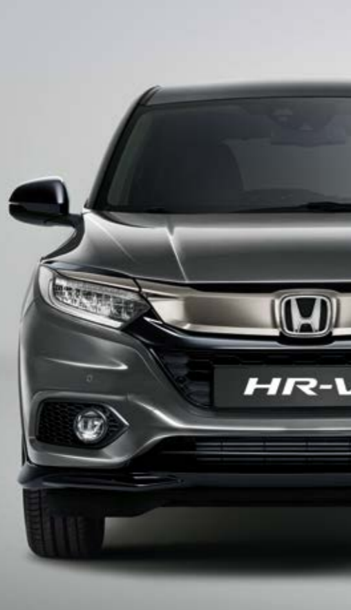
PLATINUM GREY METALLIC