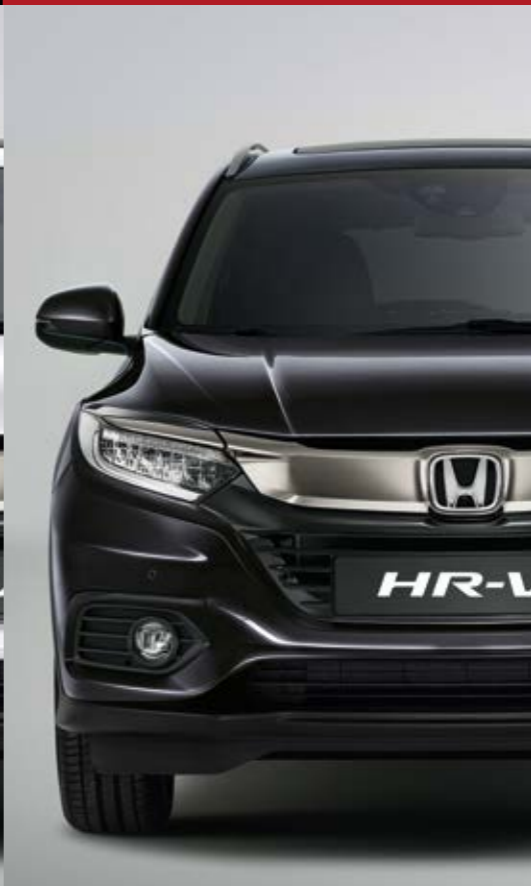
RUSE BLACK METALLIC